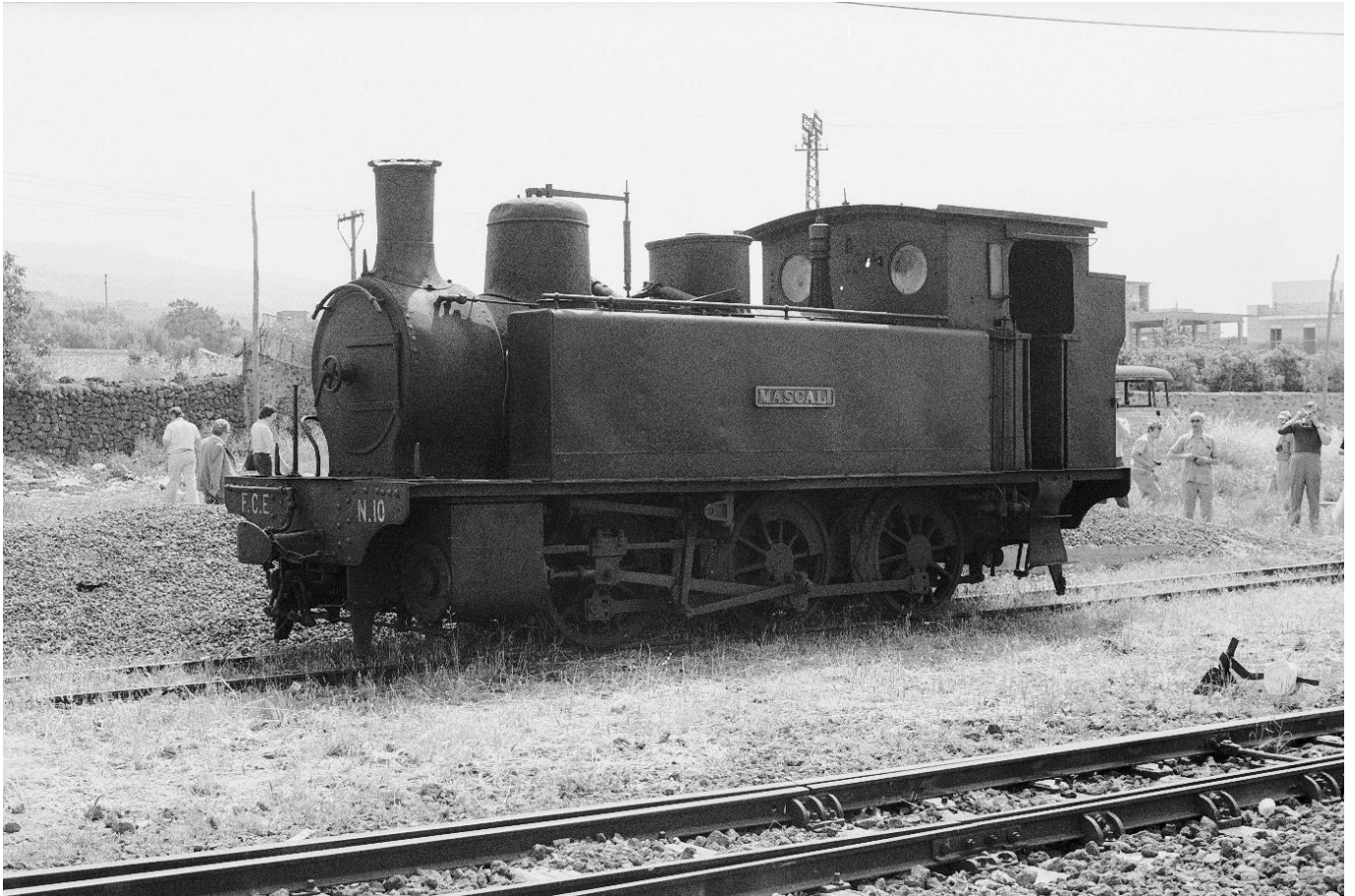
FCE Nr. 10 "MASCALI", C - h2t, bei Catania, 📷 1976