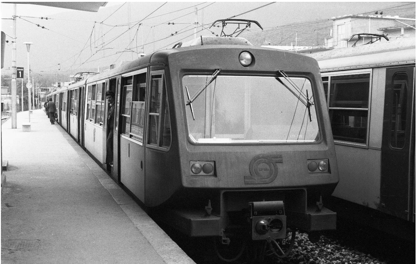
Gelenkzug ETR 001-085, Achsfolge 2'B'B'2', in Sorrento 📷 1974