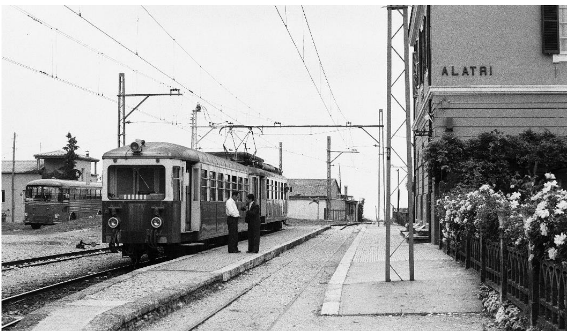
Wendezug mit TW-Reihe 460-462 in Alatri 📷 1974