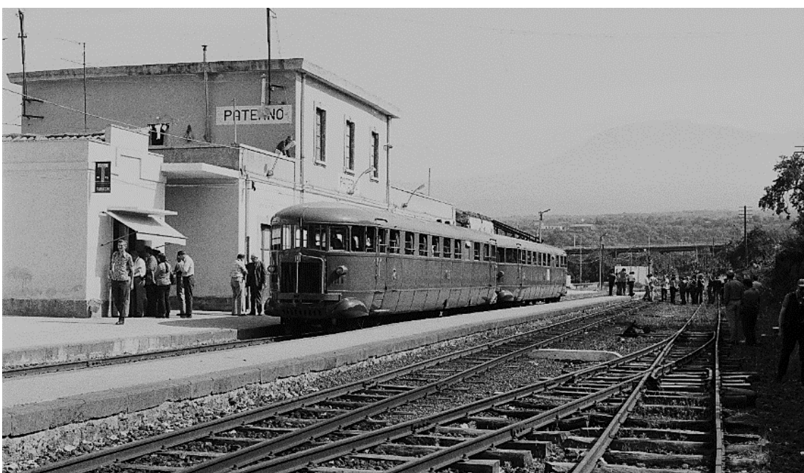
Derselbe Triebwagen- zug in Paterno 📷 1976