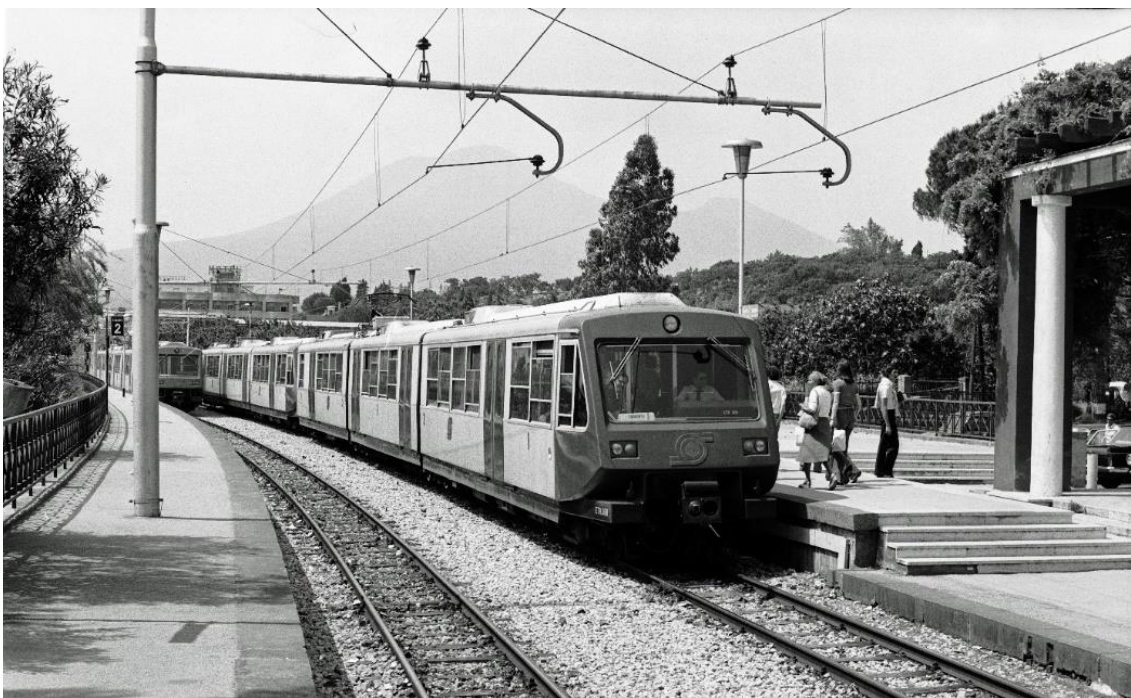
Vor dem Hintergrund des berühmten Vulkans kreuzen sich zwei ETR - Züge in Pompei Scavi