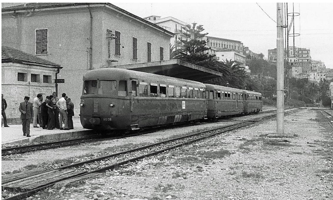
Gleicher Zug am Bahn- steig