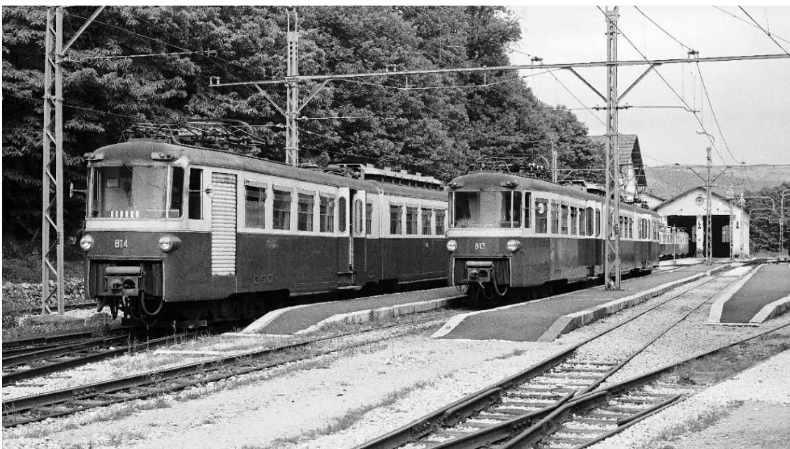
2 Gelenk- Triebwagen, Achsfolge Bo'Bo'Bo'Bo', im Bahnhof von Fiuggi: L: TW 814 R: TW 813 📷 1974