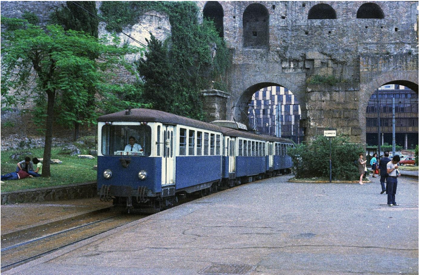
Tramzug mit TW 420...429 (Mitteltraktion) bei Hst. „Porta Maggiore“ in Rom, 📷 1976