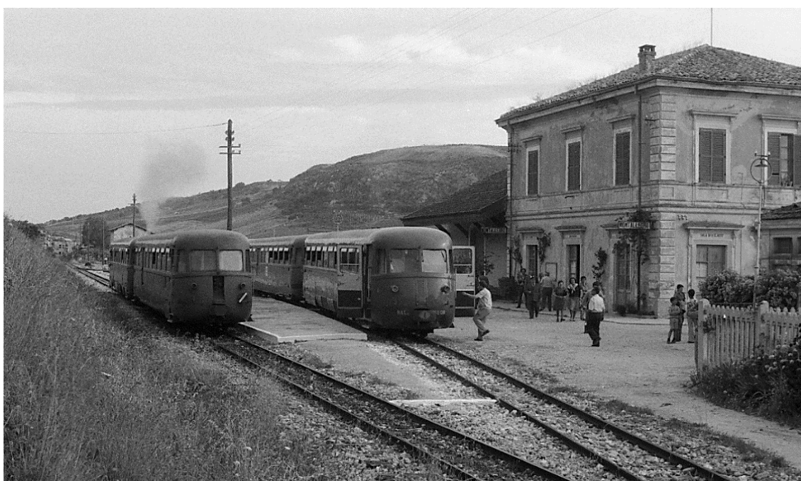
Montallegro 📷 1976