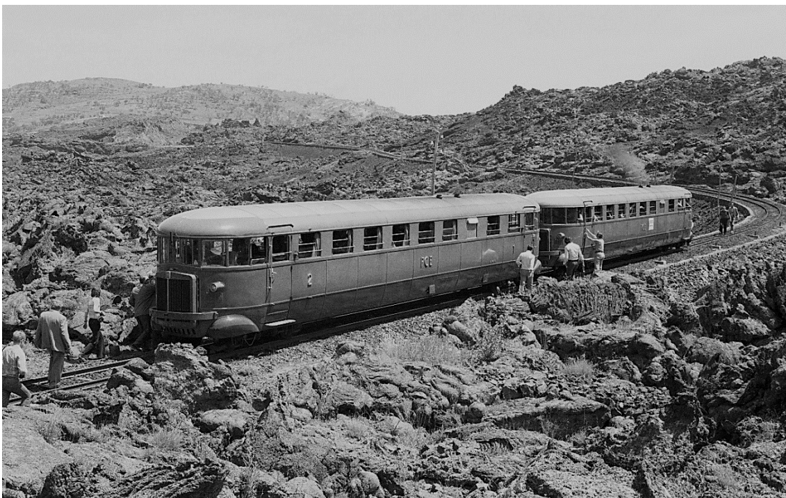
Eisenbahn- freunde des G.R.A.F. Gruppo Romano Amici della Ferrovie unterwegs: Zwei TW der Reihe AL 56 auf dem rekon- struierten Strecken- abschnitt durch die Lavafelder bei Bronte 📷 1976