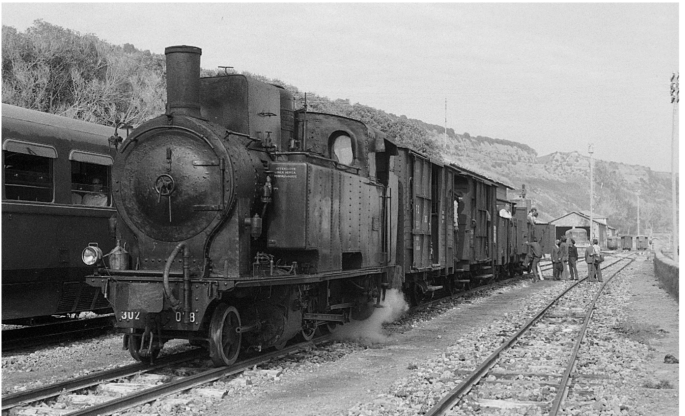
FS Gr. R 302 mit Sonderzug für Eisenbahnfreunde (in Güterwagen!) von Porto Empedocle nach Castelvetro, 📷 1976