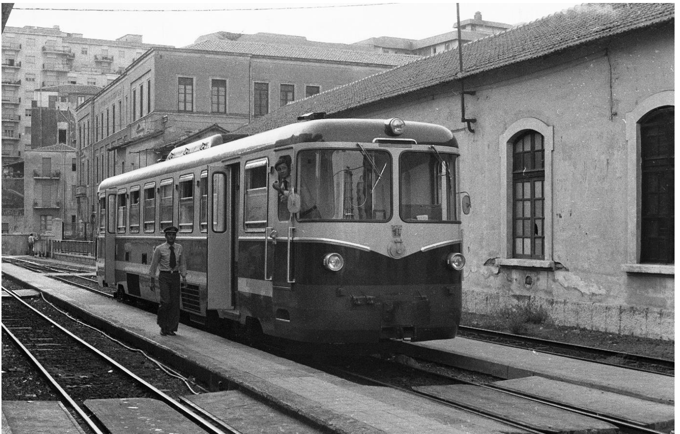
FCE ADe 11-20, Bo'Bo', Catania Borgo, 📷 1974