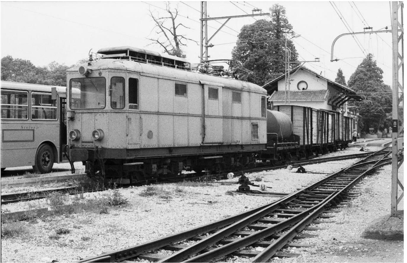
Gepäck-Triebwagen Nr. 4 in Alatri 📷 1974