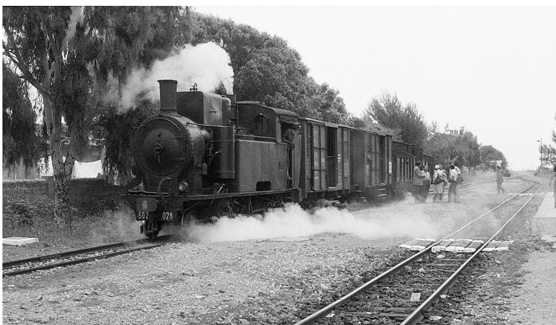
Sciacca 📷 1976 (griechische Tempel- Ruinen praktisch neben dem Bahnhof zu besichtigen)