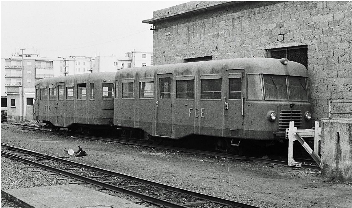
AL 35.01 + AL 35.02 1A + A1 Catania Borgo 📷 1974