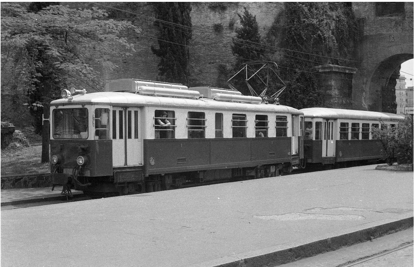
TW 460-462 mit Zug nach Fiuggi durchfährt Hst. „Porta Maggiore“ in Rom, 📷 1974