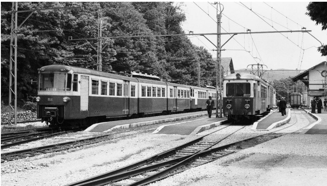
Im Bhf. Fiuggi Links: TW 814 in Doppeltrak- tion mit einem weiteren Gelenk- Triebwagen Rechts: TW 460-462 📷 1974