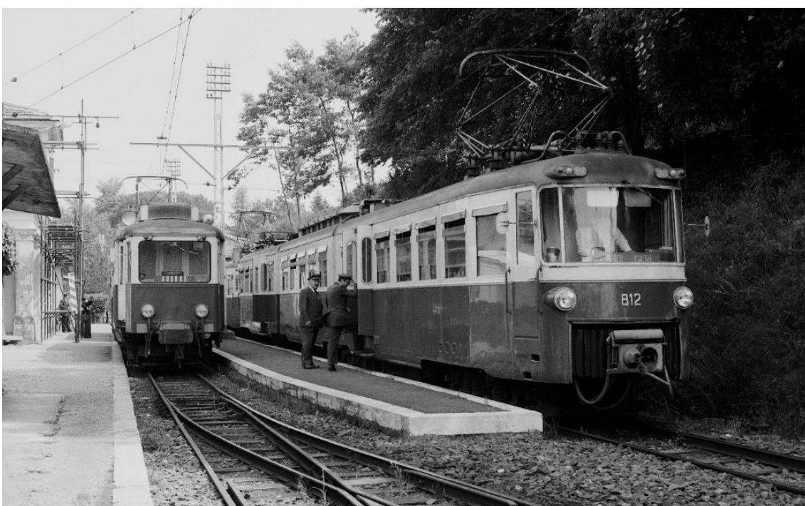
Zugskreu- zung zwischen Rom und Fiumicino. Links: TW 460-462 Rechts: Gelenkwagen TW 812 📷 1974