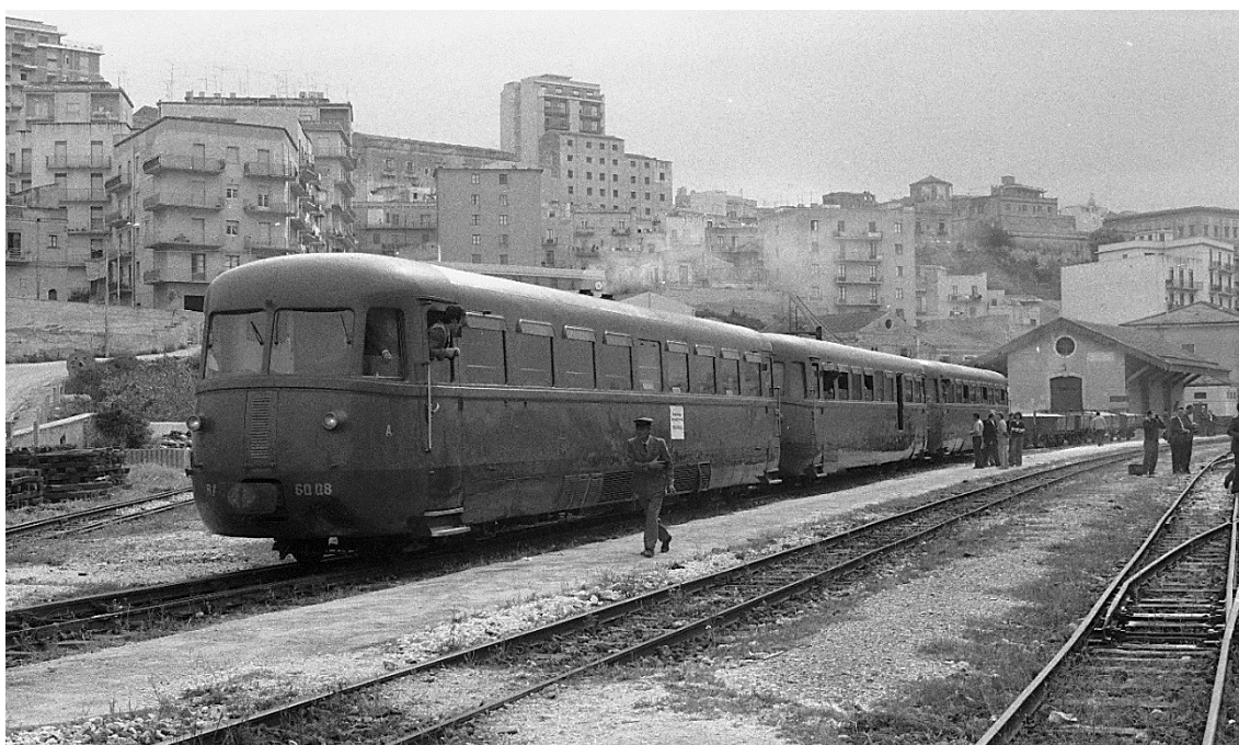
Im Bahnhofs- vorfeld: RALn 60.01 B'B' +RLDn 32 2'2' (Zwischenwg.) +RALn 60.16 B'2'

RALn 60.08 B'B' neben R 302.028 1'C - h2t