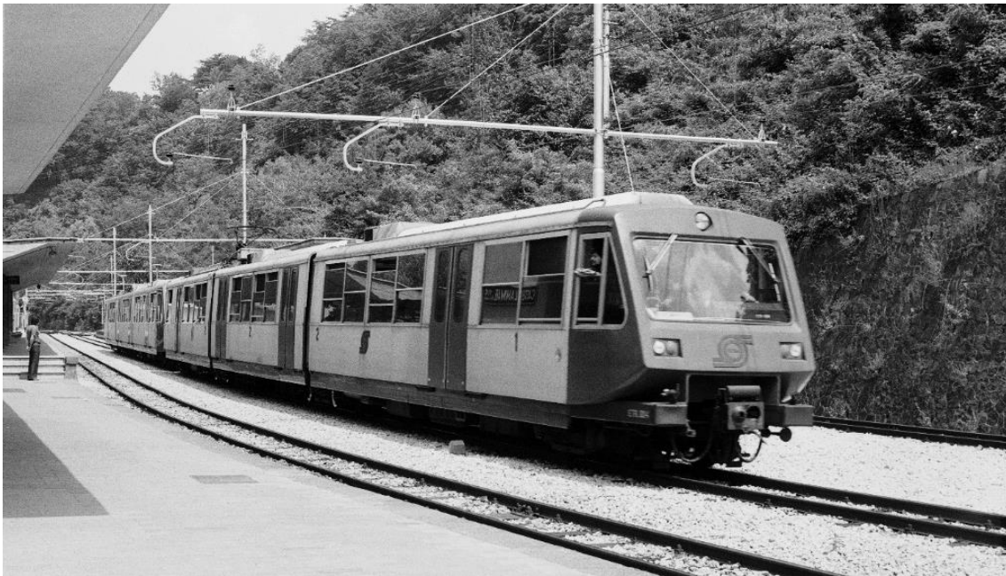
Doppel- traktion zweier Züge der Reihe ETR 001- 085 in Castellamare di Stabia