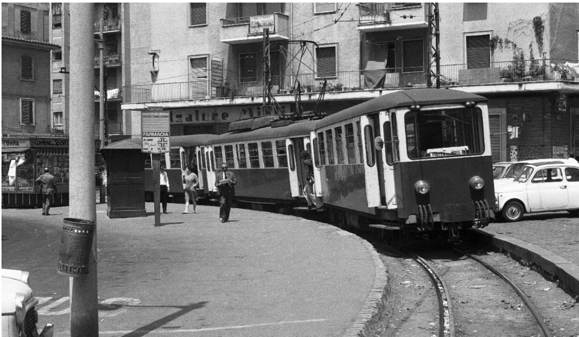
*) Nicht zu verwechseln mit dem Normalspur- Tramnetz von Rom