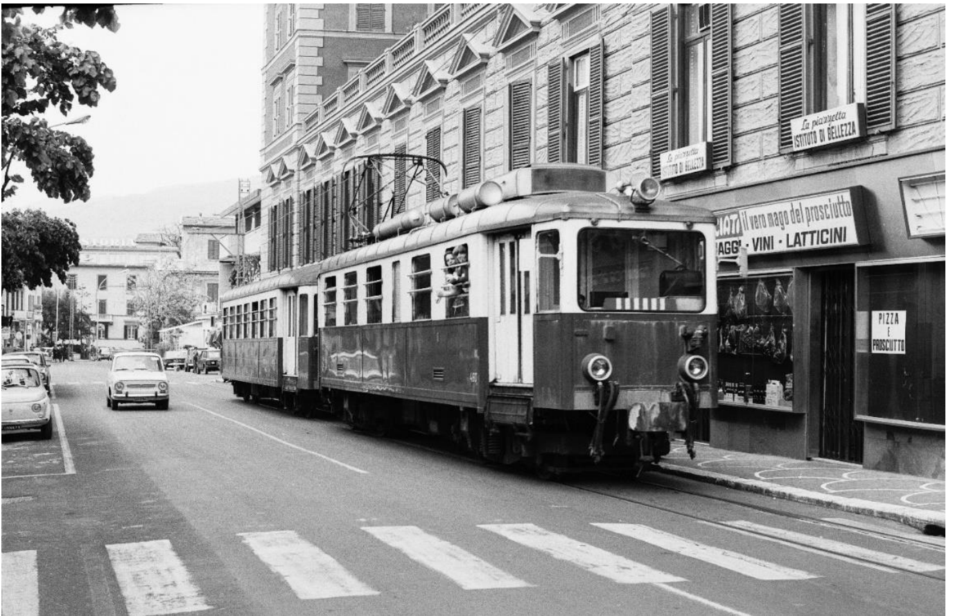
Wendezug mit TW-Reihe 460-462 verlässt Fiuggi in Richtung Rom. Streckenabschnitte in der Strasse waren selten. 📷 1974