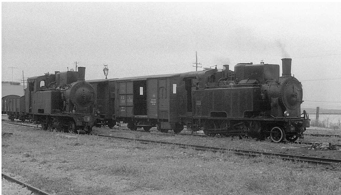
Porto Empedocle bei Agrigento Bassa 📷 1976