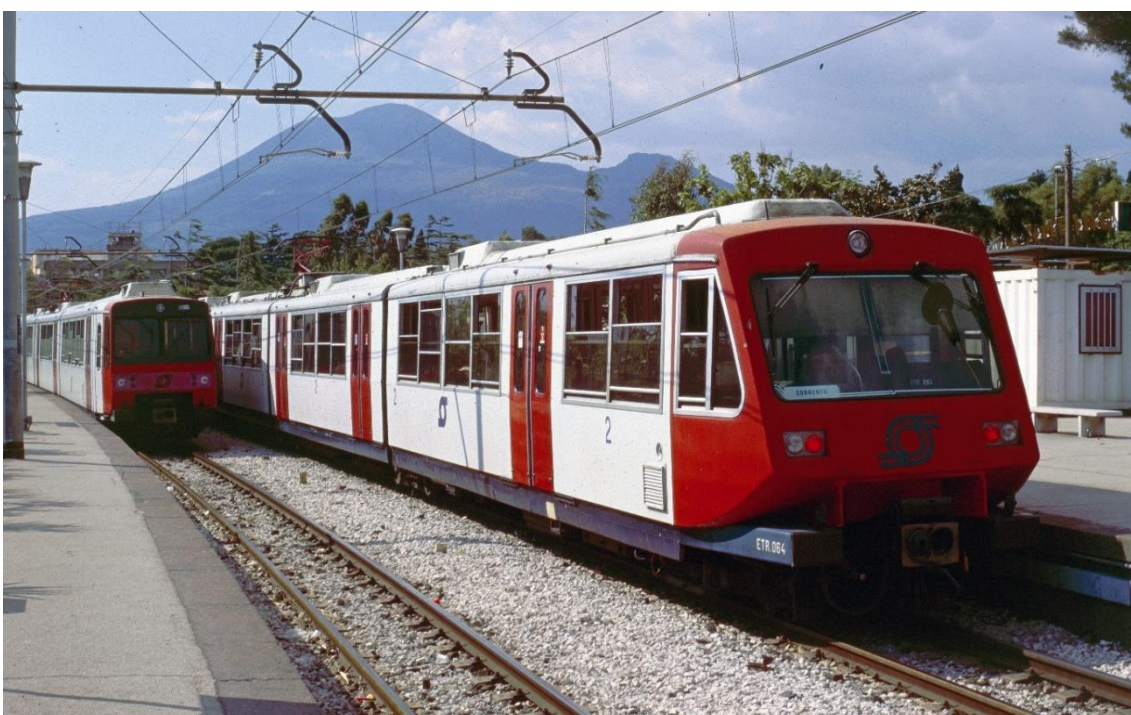
Am selben Ort kreuzen sich ETR- und T 21- Züge.