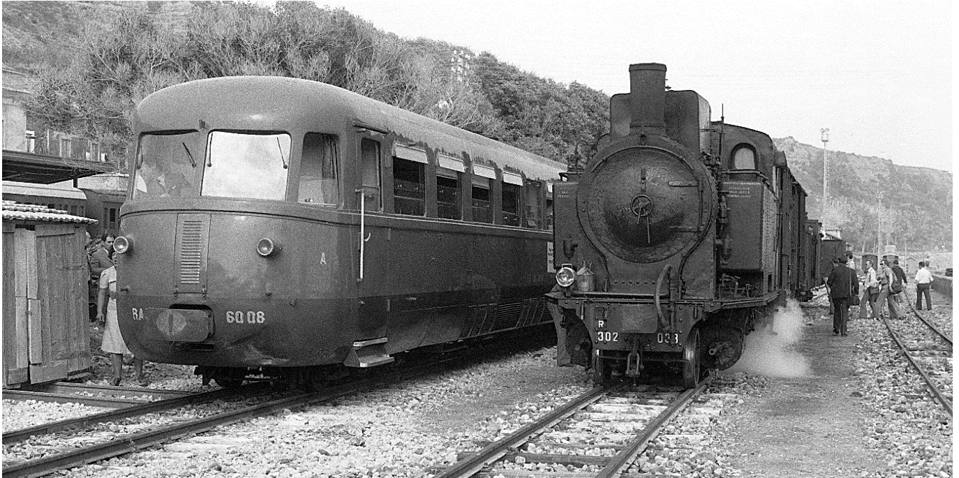
FS RALn 60.01 (B'B') neben Gr. R 302 (1'C - h2t) in Porto Empedocle (bei Agrigento Bassa), 📷 1976