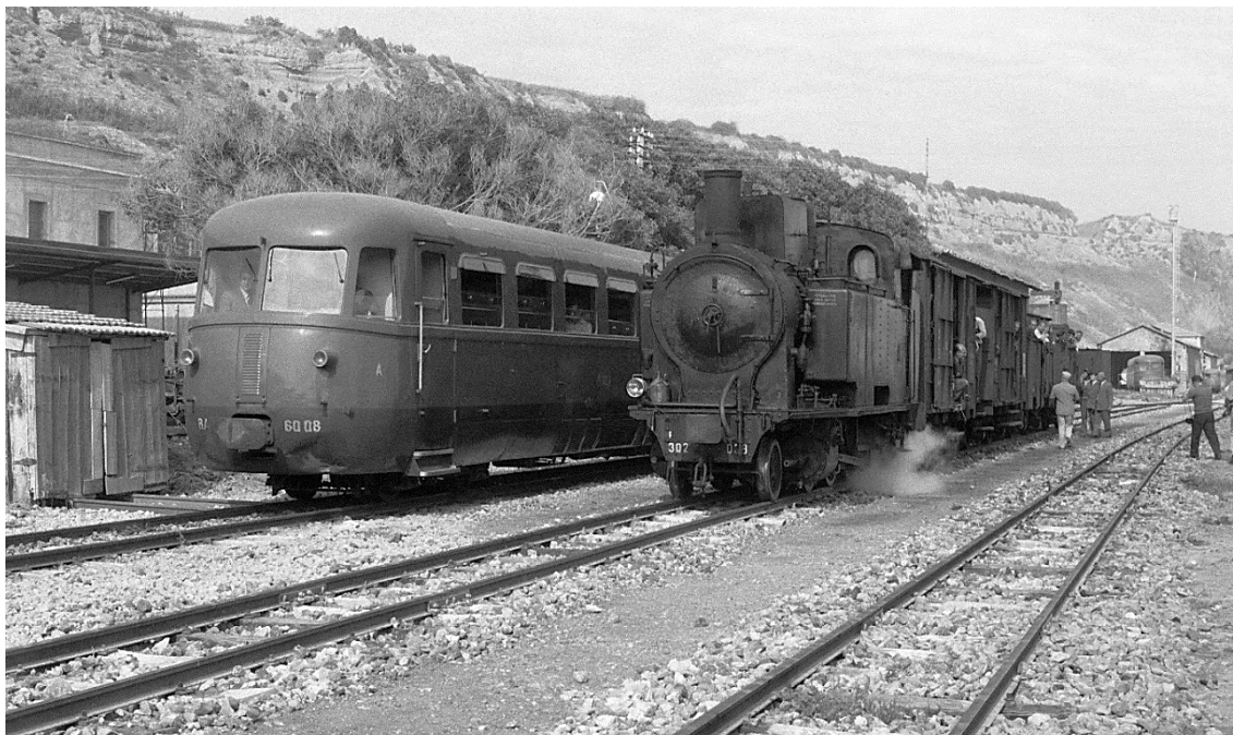
Porto Empedocle bei Agrigento Bassa 📷 1976

RALn 60.08 B'B' neben R 302.028 1'C - h2t